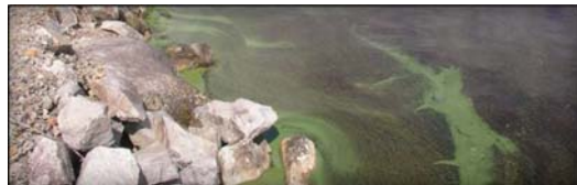
Cyanobactéries. Ministère de la Santé et des Services sociaux. (2019). Prévenir les effets sur la santé liés aux fleurs d'eau d'algues bleu-vert. Gouvernement du Québec. https://www.quebec.ca/sante/conseils-et-prevention/sante-et-environnement/algues-bleu-vert/ .